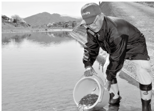
▲佐敷川に15,000尾の稚魚が放流されました。