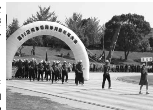
▲昨年の荒尾大会の総合開会式の様子 (葦北郡選手団の入場)

県民体育祭で行われる競技は、採点競技と公開競技が行われ、採点競技は、郡市対抗競技であり8郡市以上の参加によって実施されます。公開競技は、参加が8郡市未満の競技となります。