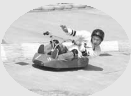
みごとなコーナーリングで走る選手