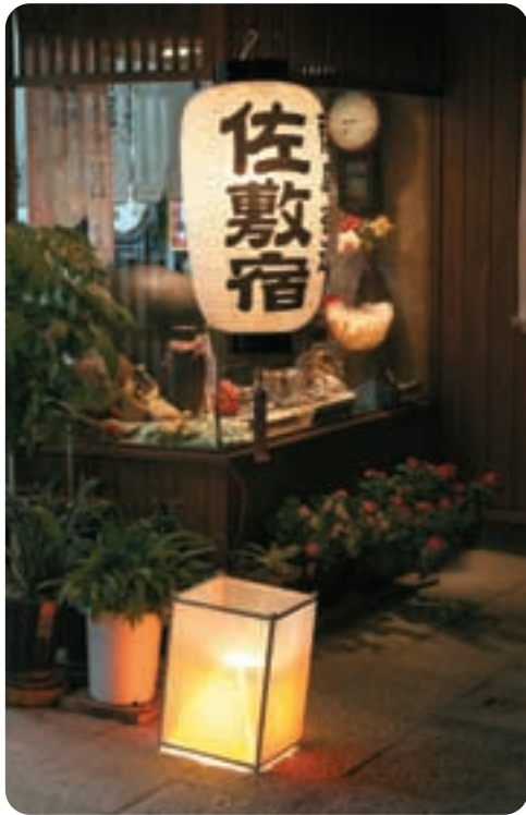
幻想的なあかりアート