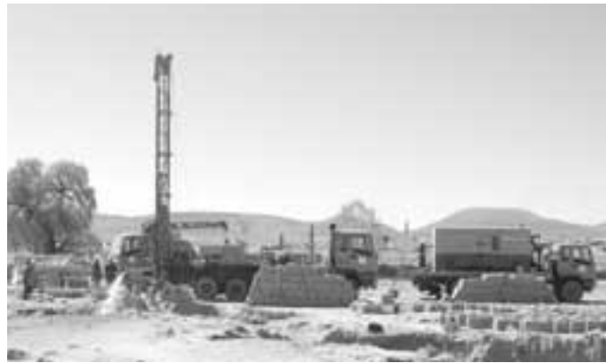
現地での井戸掘削作業

これから、こうした状況が少しでも改善されるように、しかし、主役は住民であるということを忘れず、一人よがりにならないように活動をしていきたいと思っています。