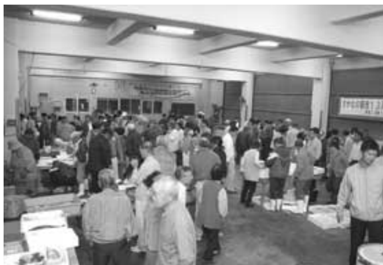
朝市で品定めを行う人たち

13周年を迎えた「さかなの朝市」が午前6時から芦北漁協で行われ、町内外から約300人が詰め掛け賑わいました。地元でとれるおいしい魚を多くの人に食べてもらいたいという趣旨で漁協の朝市部会が行っているもので、タイ、チヌ、タチウオ、グチ、タコ、イカ、カニ、エビなど活きのよい魚介類が毎回格安で販売されており、常連のお客も数多く見受けられます。当日は感謝祭として会場でコノシロの刺身と大タイの切り身が入った大鍋の味噌汁が振舞われ、美味しくておかわりするお客も見受けられました。朝市は、毎月第2土曜日と第4日曜日に行われており11月から3月までは午前7時開催となります。なお、しけなどで出漁できないときは中止の場合があります。