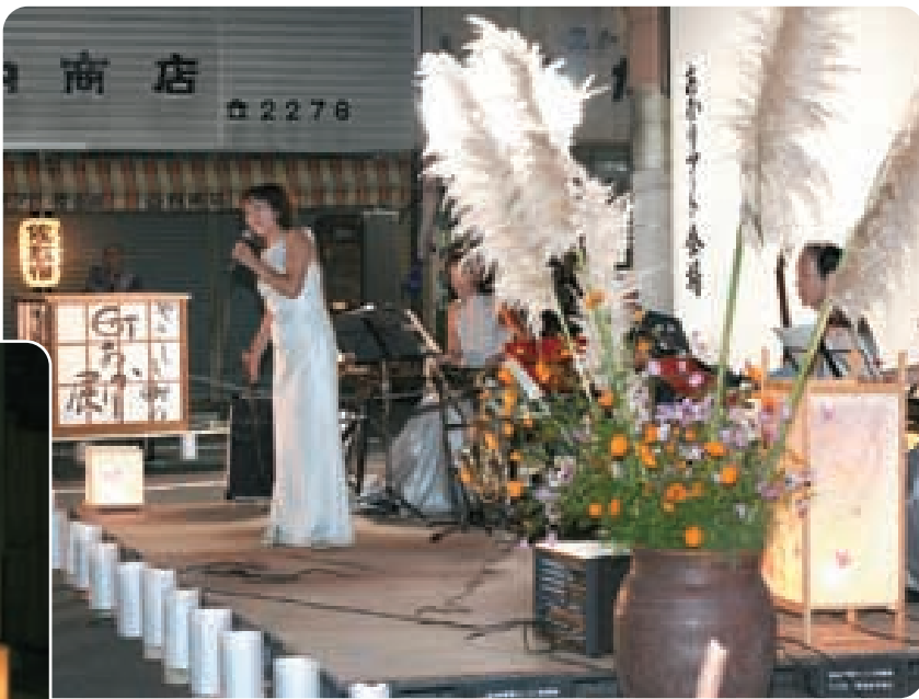
グループ「さくら」によるコンサート

また、特設会場では、グループ「さくら」によるコンサートが行われ、佐敷宿に優雅な音楽が流れました。そのほか、昔ながらの破籠弁当の展示、販売も行われ、多くの人が薩摩街道の幻想的な夜を楽しみました。