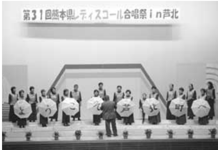
田浦オオルリ・コールの合唱