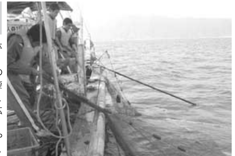
うたせ船の体験する中学生

町内の中学生(3年生226名)が「うたせ船」体験学習を実施しました。総合的な学習の時間の取り組みとして、伝統漁法の「うたせ船」乗船体験をすることにより、地元の重要な産業である漁業についての理解を深めるとともに、町の観光業についても考え、自分自身の職業観を広げる目的で実施されました。4日間とも天候に恵まれ、うたせ船の漁業方法や太刀魚釣りを体験し有意義な体験学習ができました。