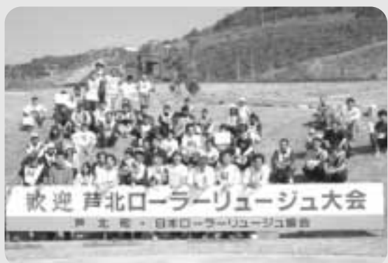
最後はみんなで記念撮影

大会では、勢い余ってコースアウトする選手もいましたが、全員がそう快な走りを見せていました。各部門の成績は次のとおり。(敬称略)