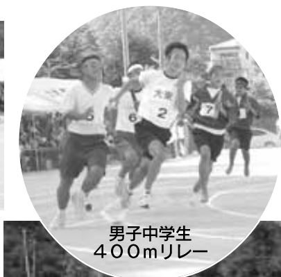
男子中学生 400mリレー