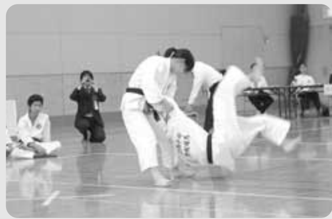
中学生有段者による組演武