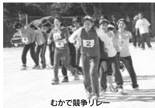
むかで競争リレー