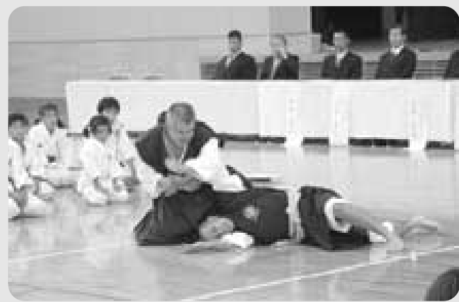
有段者による模範演技

また、閉会式では、「わたしと少林寺拳法」という題で代表者による作文発表がありました。