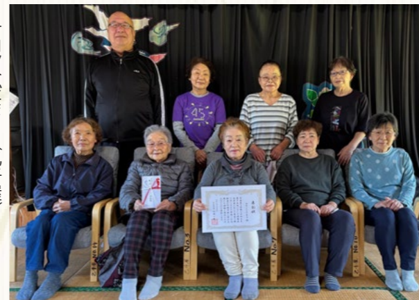
▶サロンひだまり(乙千屋)

表彰を受けたみなさんは、いきいきとした笑顔で、今後も引き続き活動に参加して盛り上げたいと話していました。 みなさんも、近所で開催される活動に参加したり、気の合う仲間とグループ活動をしたりしてみませんか？ 「どんなものかな」「やってみよう」と思ったら、お気軽にお問い合わせください。 また、町の健診を受けることが大事ですので、受診申込みをお忘れなく！