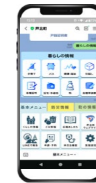
町の情報にも簡単にアクセス！