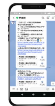
防災行政無線の内容を確認できます。

芦北町公式LINEに友だち登録すると、災害情報や避難情報、防災行政無線の放送内容などをスマートフォンで受け取ることができます。「防災行政無線が聞き取れなかった」「お知らせをもう一度確認したい」という時にも便利です。