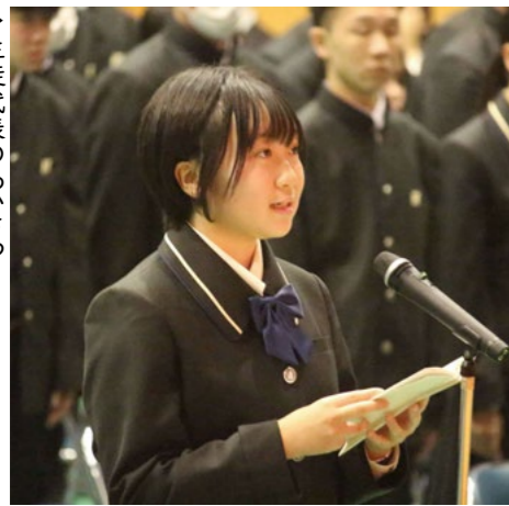
生徒代表のあいさつ