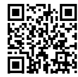
引継ぎ支援センター公式HP

熊本県事業承継・引継ぎ支援センター ☎096(311)5030 芦北町商工観光課 商工振興係 ☎0966(83)9677