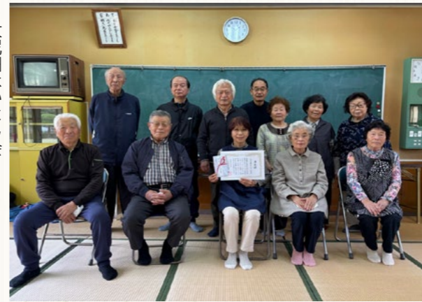
▶大尼田なかよし会

65歳以上の皆さんによる、楽しく活動できて介護予防にもなる取組を推進しています。今回、令和7年度に取り組みされた4団体に対して、表彰を行いました。 どの活動も、将来の「長寿で輝くあしきた」につながる取り組みです。グループ活動に定期的に参加したり、年1回の町の健診を受けると、その人数に応じて奨励金も授与されます。