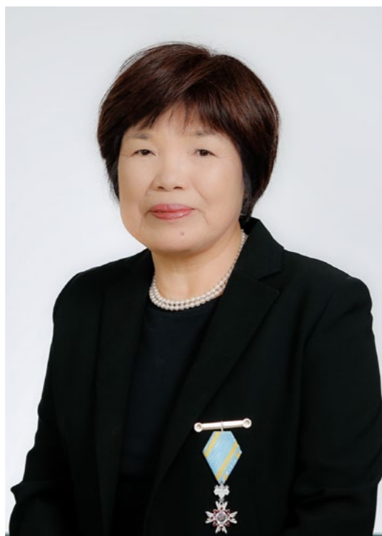
元芦北町立大野保育所長