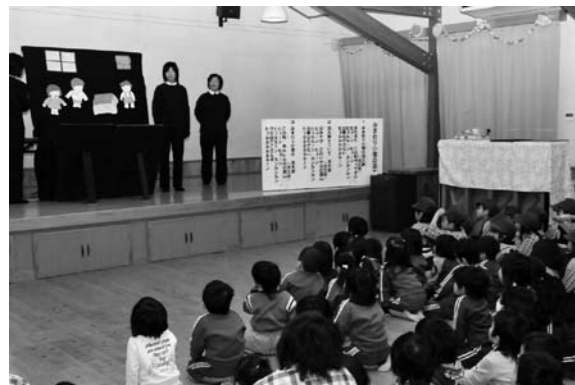
↓女性消防団員のパネル劇