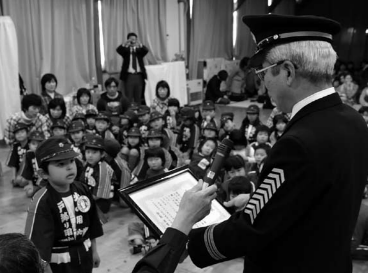
↑戸畑消防団から園児代表へ感謝状贈呈

同保育所は、昨年、熊日緑のりボン賞を受賞しており、今後もプルタブを集める運動を続けて行きたいと話されていました。