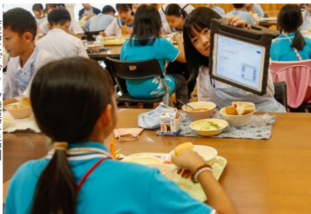
▶会話はデジタル機器を活用