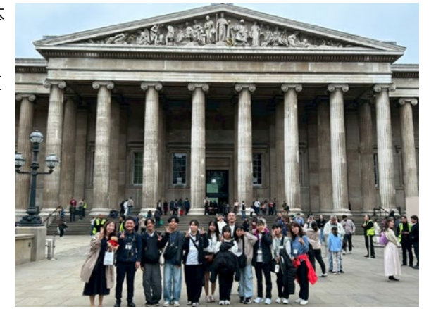
▲令和7年度の派遣団