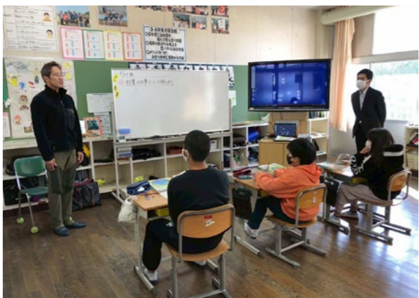
▶大野小学校での林業講座

大野小学校での林業授業を通じて未来を担う子どもたちへ森の大切さを伝えてまいりました。農業分野では、農家の方々の温かい指導のもと、気候変動や病虫害に負けない稲作に挑戦しており、卒業後の「半林半農」の生業確立に向けて圃場を拡張しました。 古石や大野地区の林家の皆様、そして地域住民の皆様の温かい支えに心より感謝申し上げます。芦北の豊かな森を守り、地域に貢献できるよう、これからも協力隊全員で力を合わせて誠実に邁進してまいります。