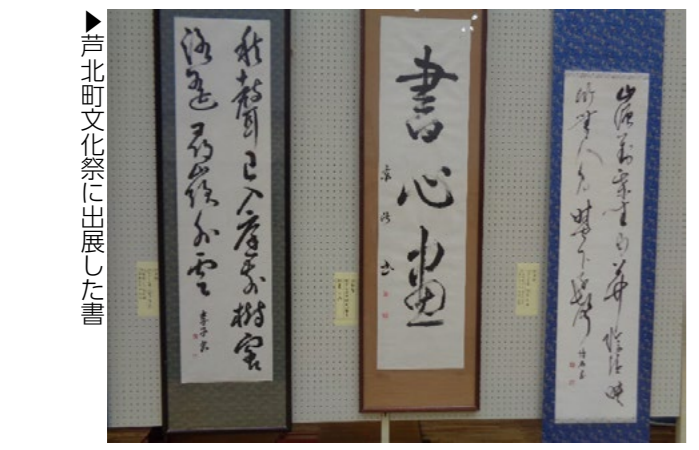
▶ 芦北町文化祭に出展した書

毎月の競書は、隷書・楷行草書、細字、手紙文、かな等全種目揮毫し、分かりやすく説明します。会員は、地域活性化センター(第1、3木曜日19時~21時)6名、コミュニティセンター(第1、3金曜