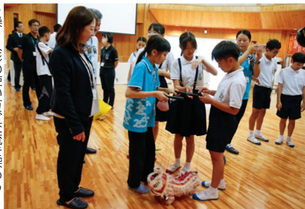
▶操り人形の使い方交流を深める