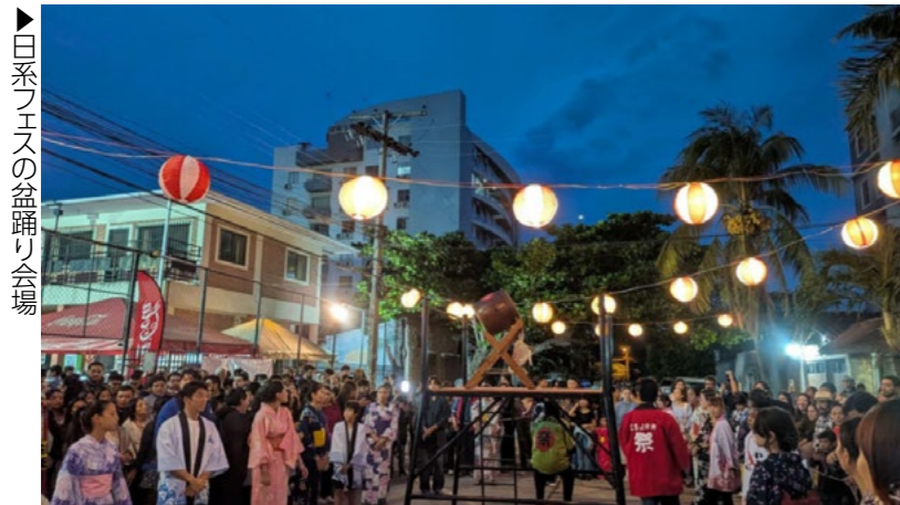
▶日系フェスの盆踊り会場

昨年11月には、サンタクルス市で「日系フェス」が開催されました。日本食やアニメグッズの販売、三線やソーラン節、空手、柔道の演武な