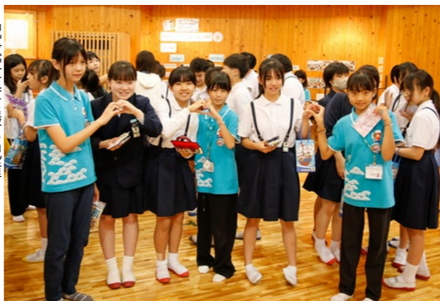
▶記念写真を撮る児童