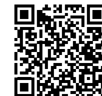
熊本県ホームページ 救急安心センター