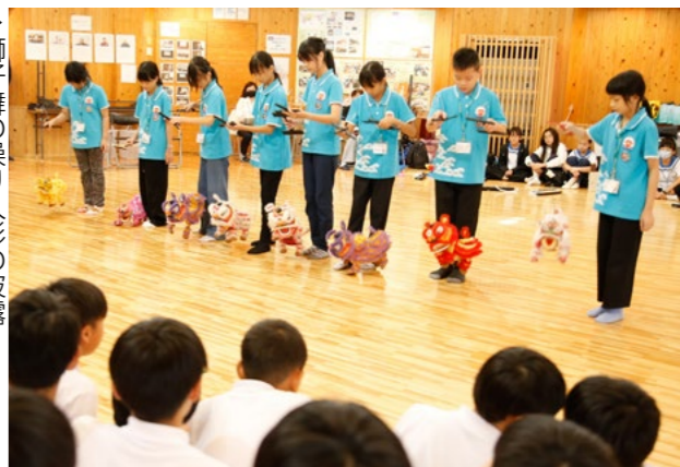
▶獅子舞の操り人形の披露