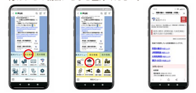
「防災情報」タブをタップ。 気象情報をタップ。 知りたい情報をチェック。

先月号でも紹介した芦北町公式LINE、実は、毎日の天気チェックから、いざという時の備えまで、防災にとっても役立つことをご存知でしょうか？ 大切なのは、いざという時に慌てないよう、普段から使い慣れておくこと。毎日の天気チェックのついでに開く習慣をつけておけば、災害の時にも落ち着いて情報を集められます。まだ友だち登録がお済みでない方は、この機会にぜひご登録ください。