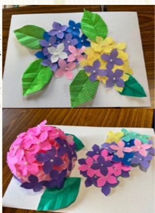
▶ 出来上がった作品