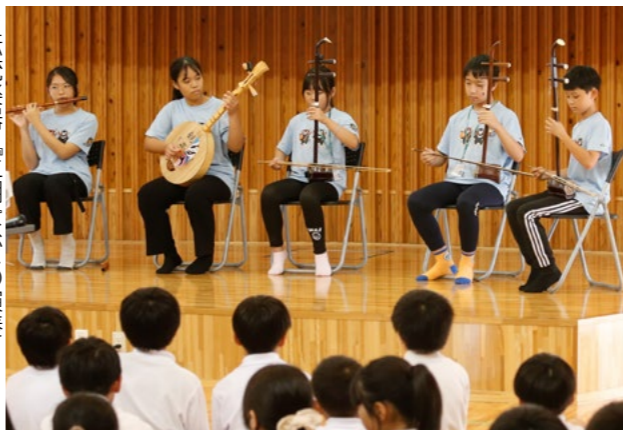
▶伝統楽器「二胡」などの演奏

台湾の児童は楽器の演奏や、踊りの披露を行い、佐敷小の児童と折り紙等で交流しました。学校給食では向かいに座り、タブレットやスマホで翻訳を行いながら、会話を楽しみました。